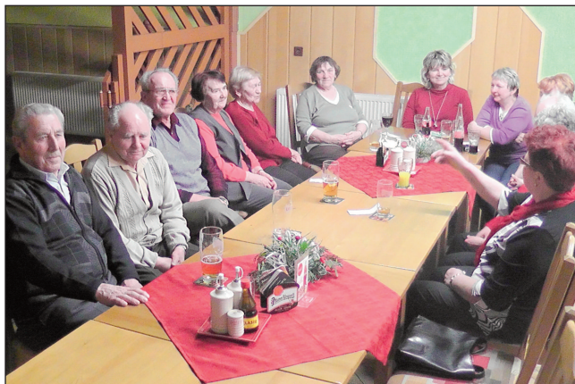
V restauraci Ve Votáčce se začátkem března sešli bývalí zaměstnanci podniku Jitona v Bohumilicích