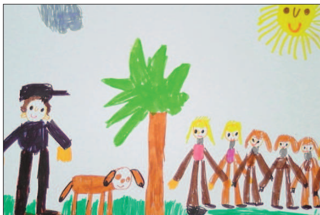
Policie ve školce